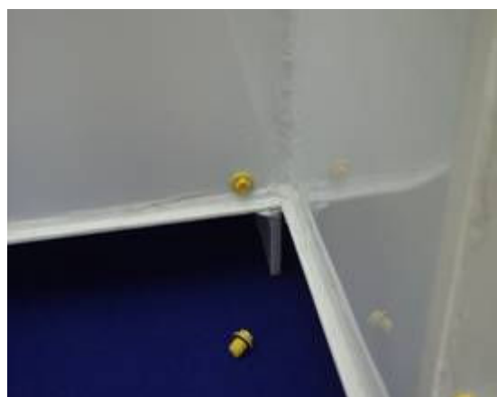
Obr. číslo 3