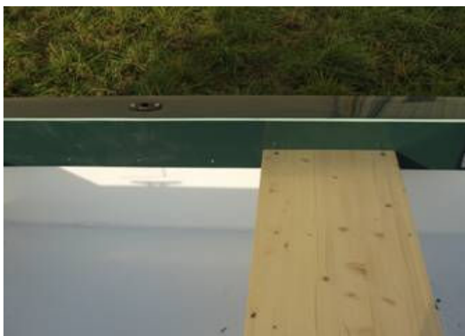
Obr. číslo 4

Dále je plavidlo vybaveno sedačkou, kterou je možno posouvat podle Vašich potřeb a podle volby pohonu plavidla. Montáž sedačky provádíme do předvrtaných děr viz obr. číslo 4.