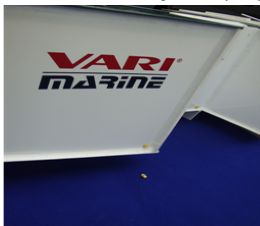
Obr. číslo 2