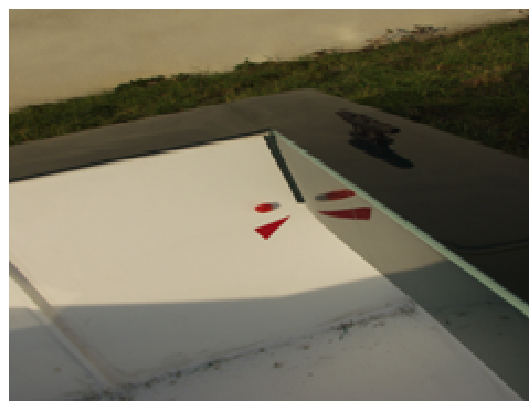
Obr. číslo 1.